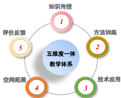
图35 多维度递进式教学体系